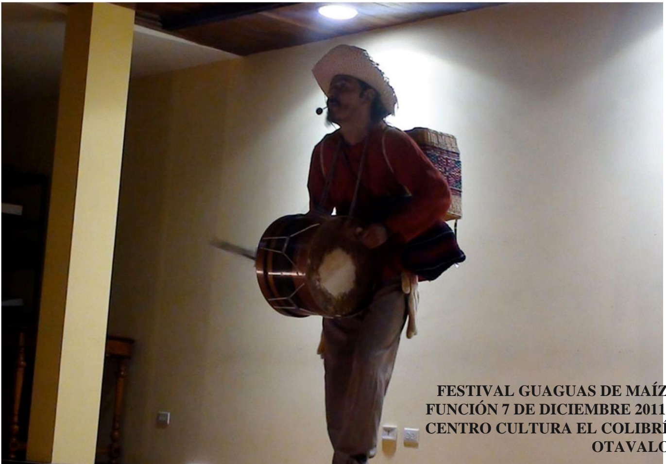
FESTIVAL GUAGUAS DE MAÍZ FUNCIÓN 7 DE DICIEMBRE 2011 CENTRO CULTURA EL COLIBRÍ OTAVALO