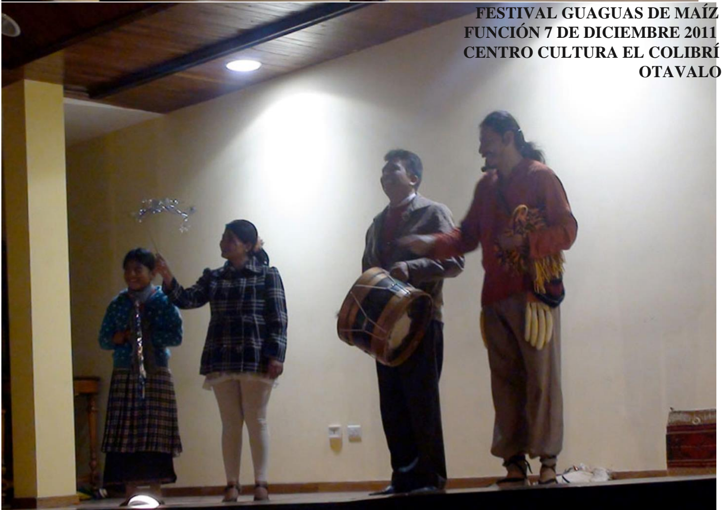
FESTIVAL GUAGUAS DE MAÍZ FUNCIÓN 7 DE DICIEMBRE 2011 CENTRO CULTURA EL COLIBRÍ OTAVALO